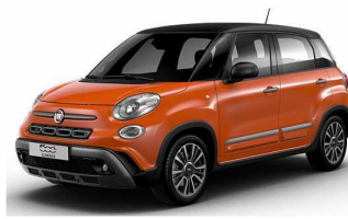
код фарби 972