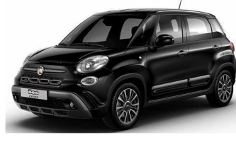
код фарби 601