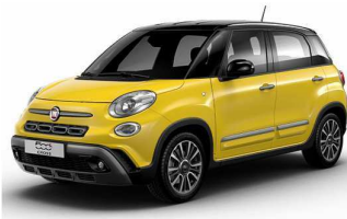
код фарби 828