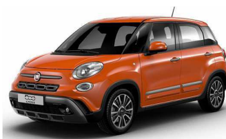
код фарби 678