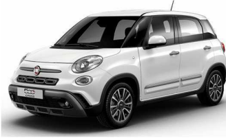
код фарби 268