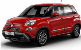
код фарби 111