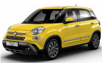
код фарби 830