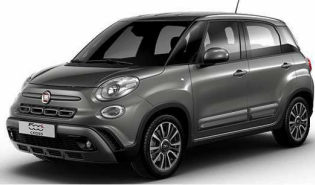
код фарби 609