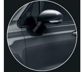
код фарби 679