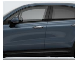
Забарвлення кузова фарбою металік код фарби 731