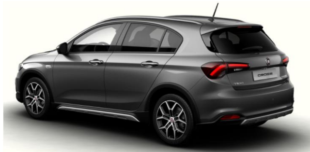
Забарвлення кузова фарбою металік (код 405)