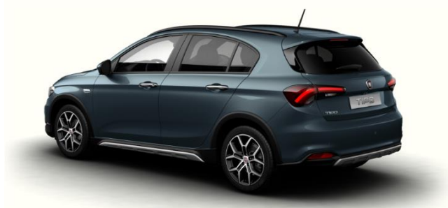
Забарвлення кузова фарбою металік (код 718)