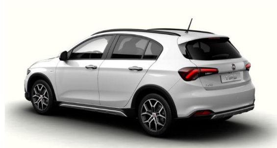
Забарвлення кузова пастельною фарбою (код 168)